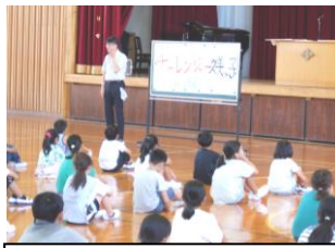
始業式でのスローガンの話

10月11日(水)には、マラソン大会があります。マラソンでもチャレンジャーとして目標をもって取り組んでいきます。沿道でのご応援をどうぞよろしくお願いいたします。